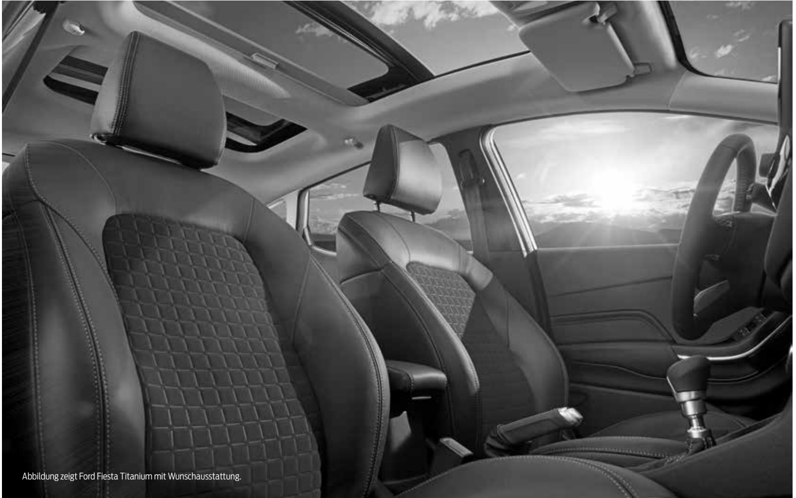
Abbildung zeigt Ford Fiesta Titanium mit Wunschausstattung.