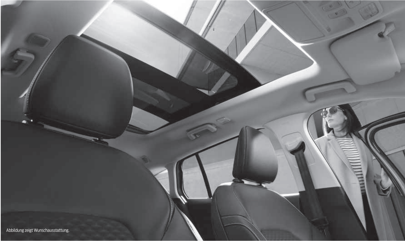
Abbildung zeigt Wunschausstattung.