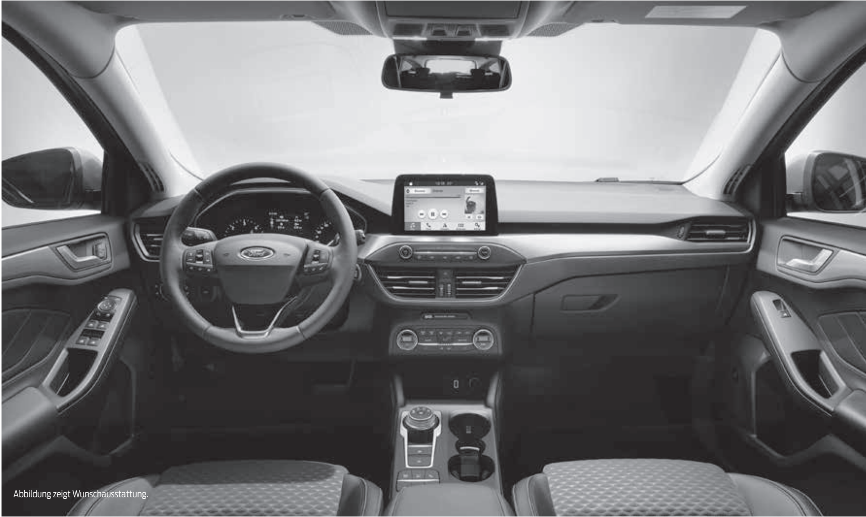
Abbildung zeigt Wunschausstattung.