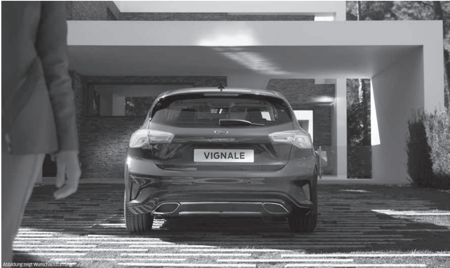
Abbildung zeigt Wunschausstattung.