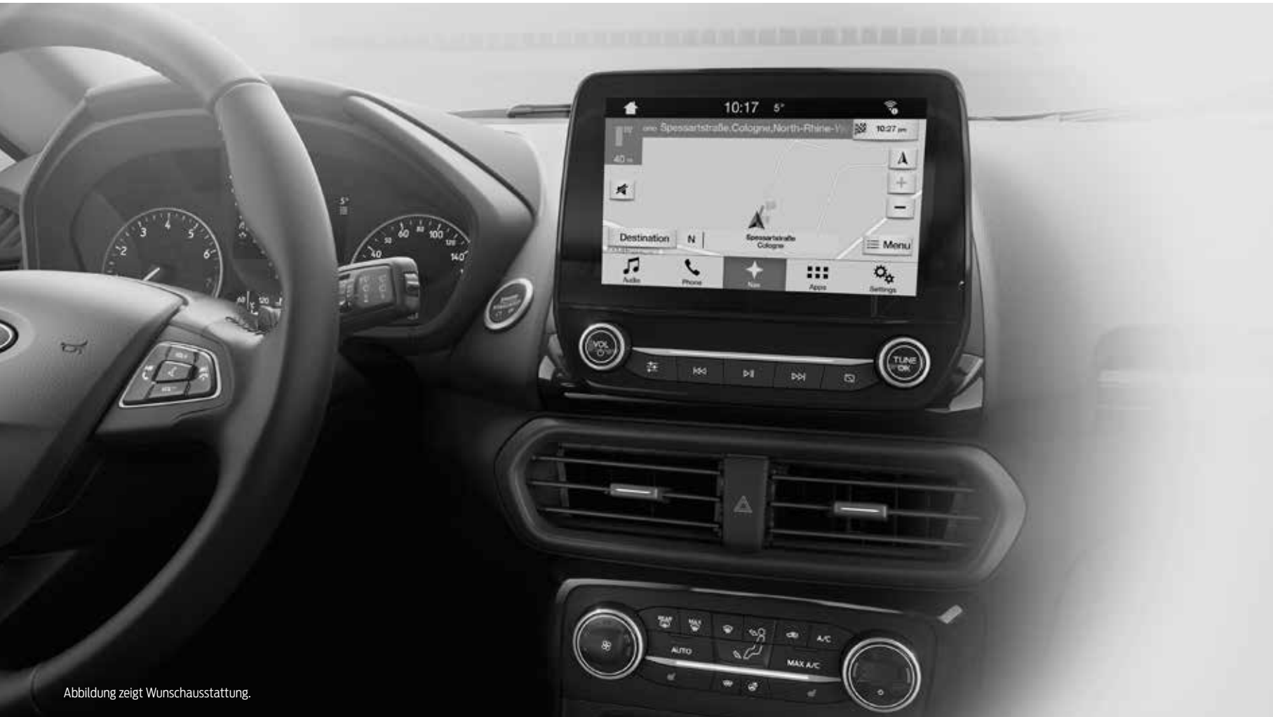
Abbildung zeigt Wunschausstattung.